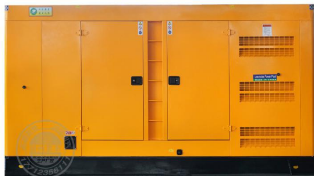
静音型机组（需选装）